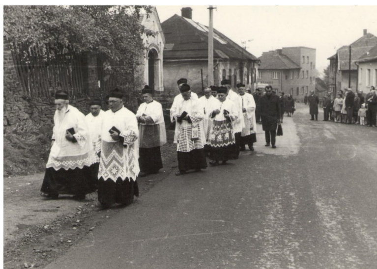
Při slavnosti Božího těla ve Slatině