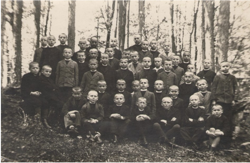
Se seminaristy ve Vídni

V této chvíli přichází prosba maminky, která si přála, aby neodcházel příliš daleko do nebezpečných misijních míst, neboť ztratila již nejstaršího syna a těžce