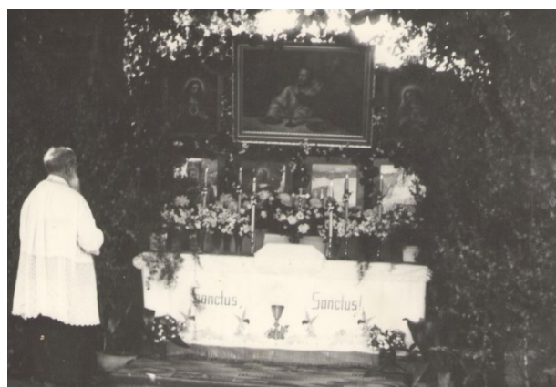
Boží tělo ve Slatině