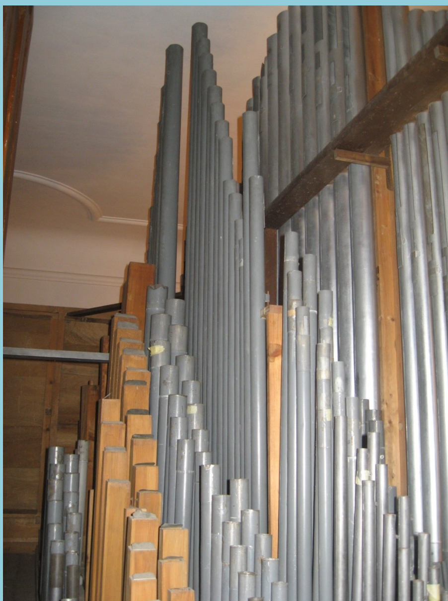
Píšťaly fond 1. manuálu