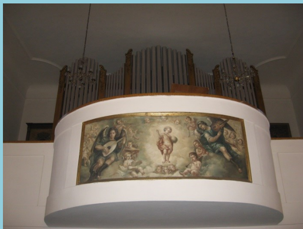
Pohled na kůr s obrazem