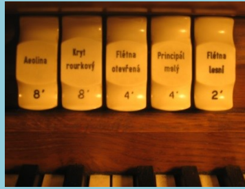
Rejstříky II. manuálu