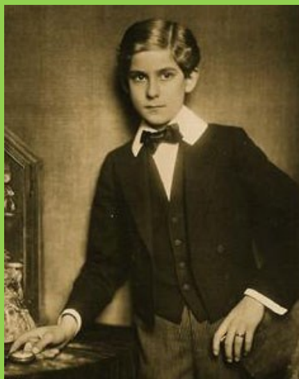
Ernest Hohenberg - syn Františka Ferdinanda